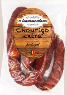
Chorizo extra (m) O TRANSMONTANO 720 g 🚚