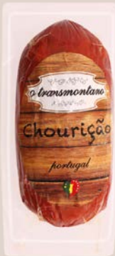
Gros Chorizo Chouricao (m) O TRANSMONTANO 500 g 🚚